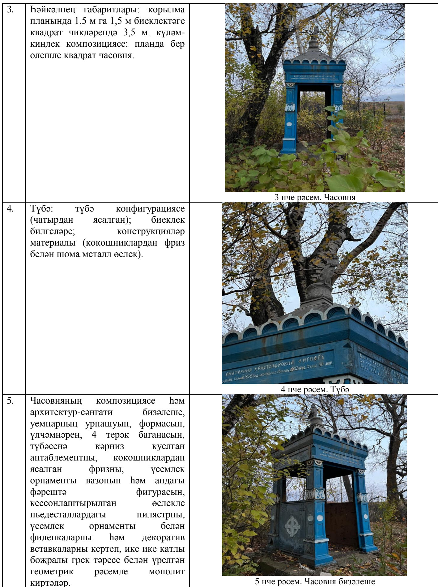
3 нче рәсем. Часовня