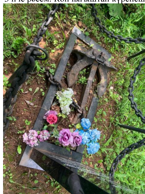
4 нче рәсем. Өстән күренеш