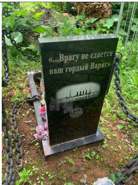
3 нче рәсем. Көнчыгыштан күренеш