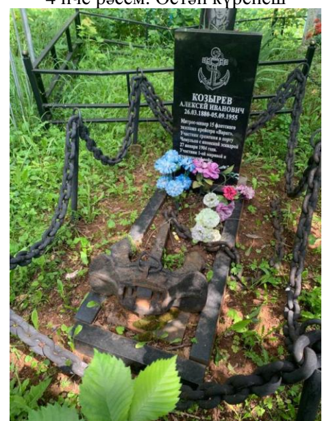
5 нче рәсем. Вид с запада