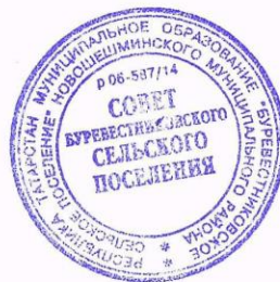
Ю. М. Улитин

Буревестник авыл жирлеге башлыгы Яңа Чишмә муниципаль районы Татарстан Республикасы