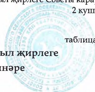
таблица 1 2022 елда Зәй муниципаль районының Иске Маврин авыл җирлеге бюджеты керемнәренәң фаразлана торган күләмнәре

"2022 ел өчен Зәй муниципаль районының Иске Маврин авыл җирлеге бюджеты үтәлеше турында" Зәй муниципаль районының Иске Маврин авыл җирлеге Советы карарына 2 кушымта