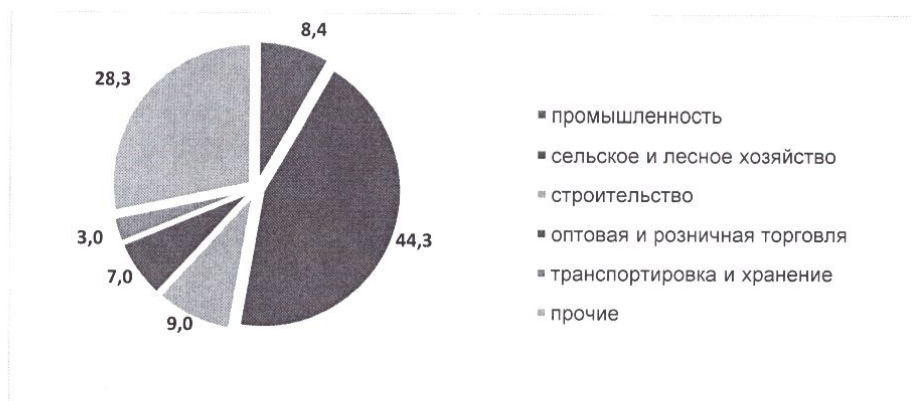
1 нче рәсем. Тулай территорияль продукт структурасы, %

Бүген АМР икътисадының төп юнәлеше - авыл хужалыгы житештерүе. Авыл хужалыгы житештерүе - терлекчелек һәм үсемлекчелек.