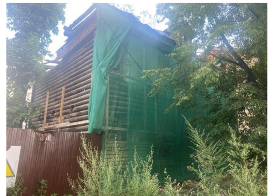
Һ.Атласи урамы ягыннан бинаның гомум күренеше