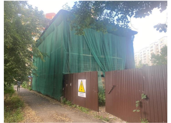
Һ.Атласи урамы ягыннан бинаның гомум күренеше

- бинаны бизәгәндә һәм торгызганда тарихи материаллардан файдалану (тыгыз тышлау, сырлы декор, агач)