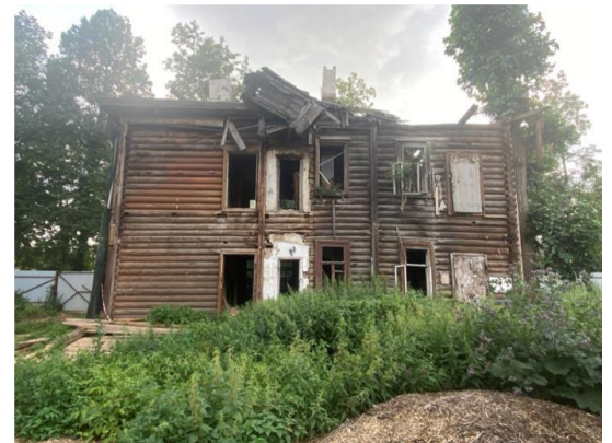
Бинаның көнчыгыш фасады

2. Шәһәр төзелеше эшчәнлегә секторына территорияль планлаштыруның Федераль дәүләт мәгълүмат системасында (ФГИС ТП) Казан шәһәренең төбәк әһәмияттәге тарихи жирлек территориясе чикләрендә саклау предметы үзгәрүе турында мәгълүмат урнаштыруны тәмин итәргә.