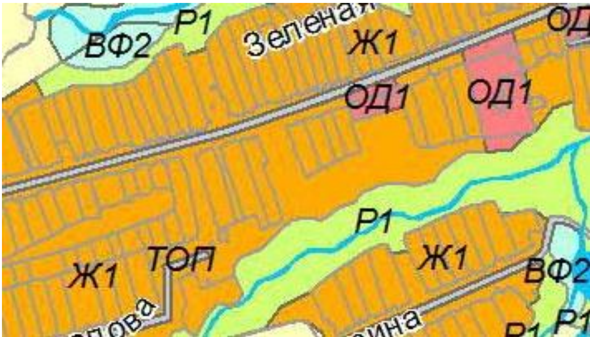
Зур Полянка авыл жирлегенең шәһәр төзелеше зоналашуы картасының фрагменты, Красный Баран авылы (хәзерге хәле)