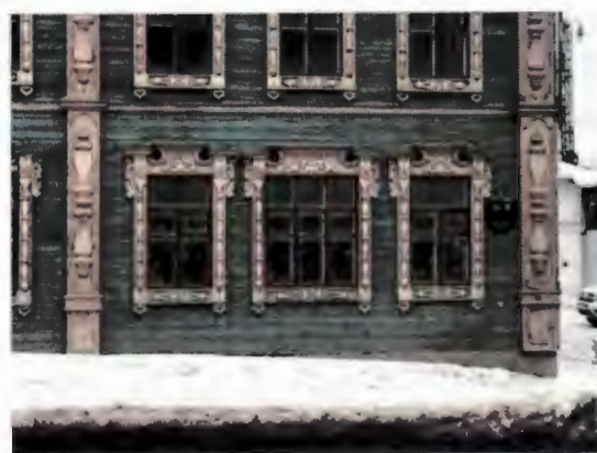
1 катның тәрәзэләре