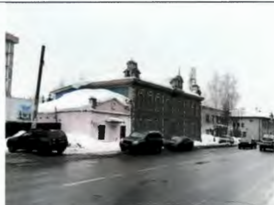
Гладилов урамыннан бинаның гомум күренеше

Рөхсәт ителә: йортның тышкы кыяфәтен, габаритларын һәм биеклек тамгаларын саклаган бинаны төзекләндерү, реконструкцияләү; тарихи рәсем һәм материалны саклап, тәрәзә һәм ишек тутырылышларын ремонтлау, алыштыру; бинаны бизәгәндә һәм торгызганда тарихи материаллардан файдалану (тыгыз тышлау, сырлы декор, агач)