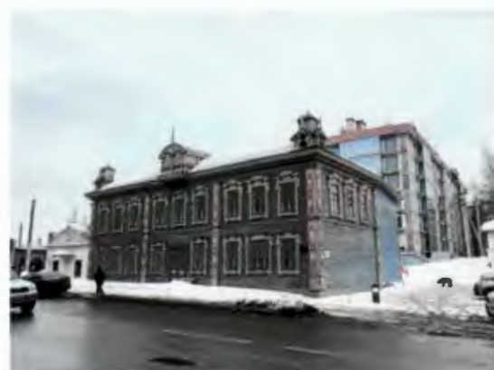
Гладилов урамыннан бинаның гомум күренеше