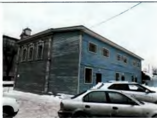
Ишегалды ягыннан гомум күренеш