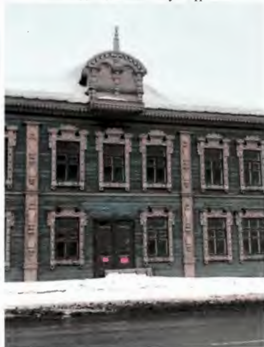
Төп фасадның үзэк өлеше