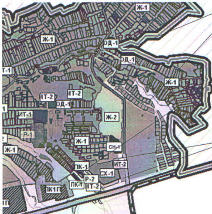
после внесения изменений

поз.1.1 ул.Красная, ул.Покровская - жилая застройка зона застройки индивидуальными жилыми домами Ж-1