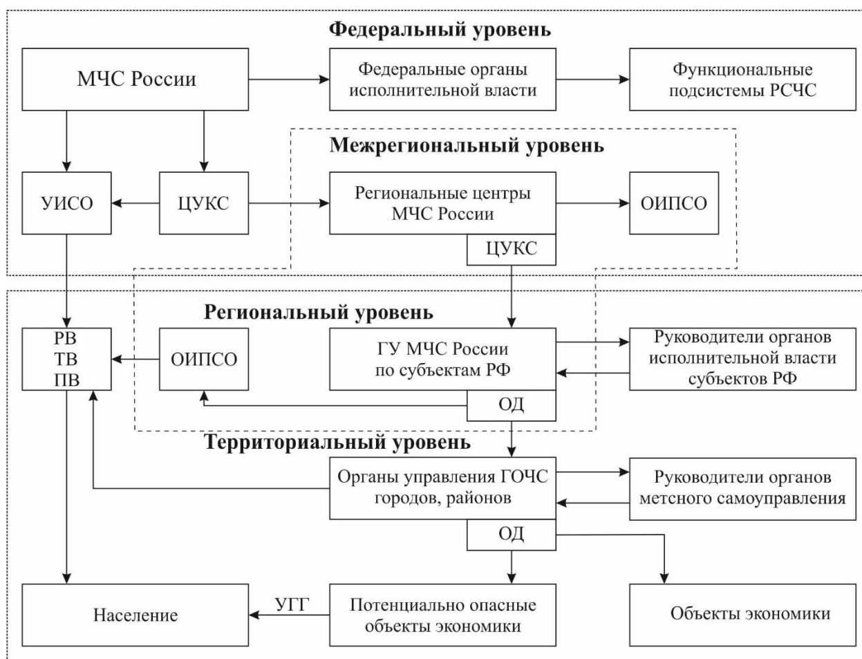
5.6.1 рәсем – Фаразлана торган һәм килеп чыккан гадәттән тыш хәлләр һәм янгыннар турында халыкка мәгълүмат бирүне оештыру схемасы.

3.1. рәсемдә кабул ителгән кыскартылмалар: ОД - оператив дежурный; РВ - радиовещание; ТВ - телевидение; ПВ - проводное вещание; УГГ - уличные громкоговорители; ЦУКС - Центр управления в кризисных ситуациях; УИСО - Управление информации и связи с общественностью; ОИПСО - отделы информации, пропаганды и связи с общественностью.