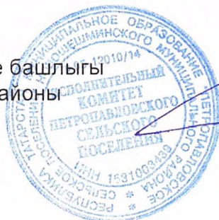
Д. С. Никитин

Петропавел авыл җирлеге башлыгы Яңа Чишмә муниципаль районы Татарстан Республикасы