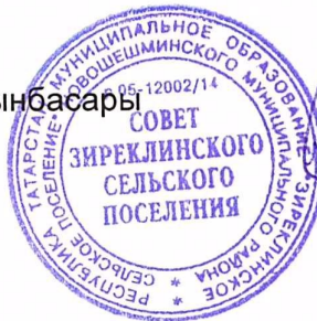
Садыйков М. Х.

Татарстан Республикасы Яңа Чишмә муниципаль районы Зирекле авыл Советы башлыгы урынбасары Авыл җирлеге башлыгы