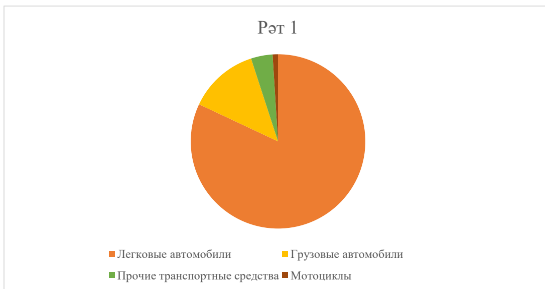
Рәсем 3 – транспорт төрләре буенча Иске Юраш авылы жирлеге

Муниципаль берәмлек территориясендә – Иске Юраш авыл жирлеге транспорт чараларының актив паркына сан ягыннан һәм сыйфатлы анализ үткәрү өчен Россия Федерациясе Федераль салым хезмәтенә (Россия Федерациясе Федераль салым хезмәте) хисаплары кулланылды. Иске Юраш авылы буенча 2016 елга транспорт саны 306 транспорт чарасы булган. Шәһәр территориясендә теркәлгән транспорт чараларының зур өлешен жиңел автомобильләр тәшкил итә, Транспорт төрләре буенча тулырак мәгълүмат диаграммада күрсәтелгән (рәсем 3).