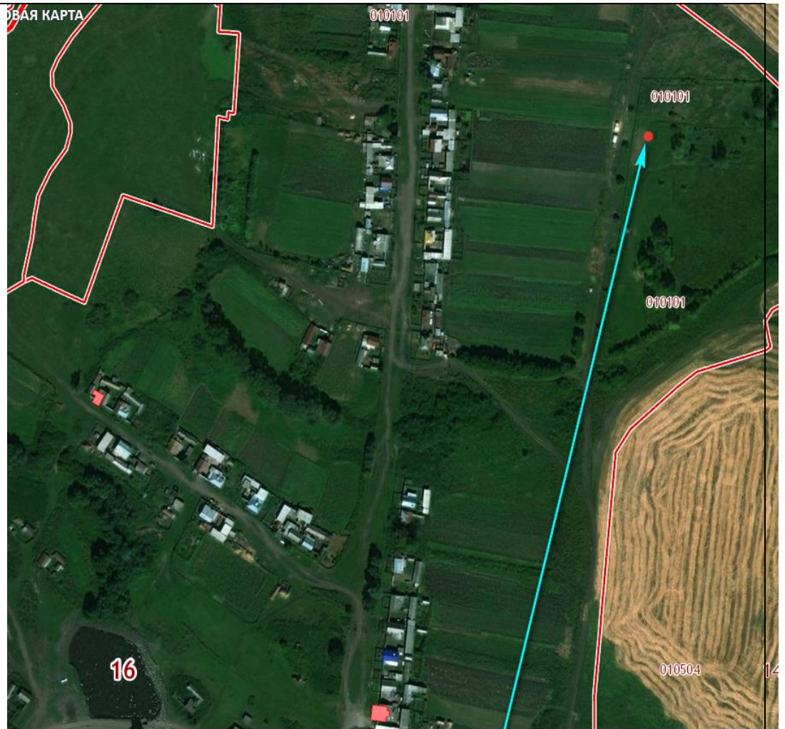
Место (площадка) накопления ТКО

Әлки авылы, Интернацио нал урамы, зират, Кадастр номеры 16: 14: 010101