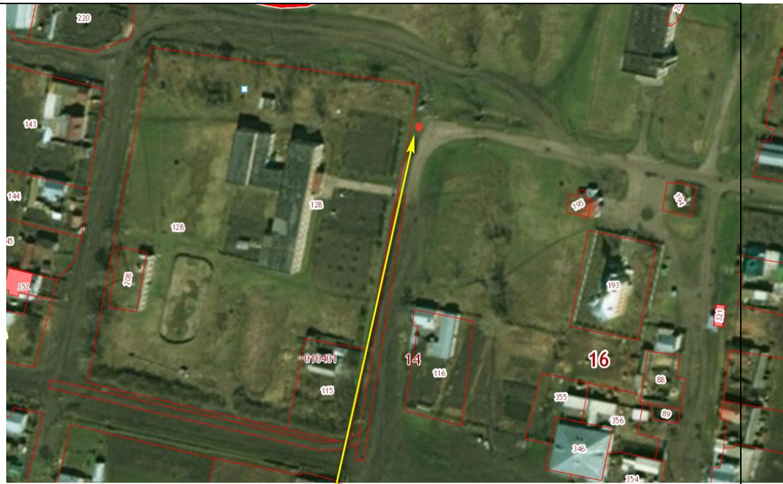
Место (площадка) накопления ТКО

3. Атабай- энкөмө авылы, Буа- Исаково юлы, кадастр номеры 16: 14: 010301