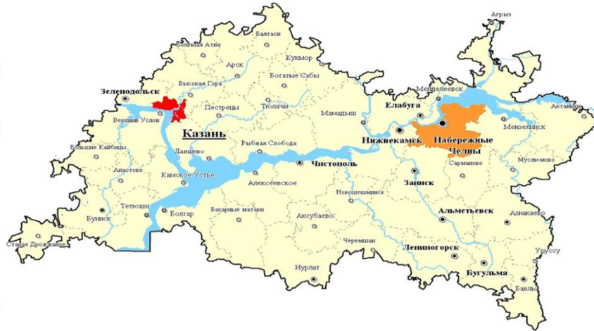
Рис. 1. Тукаевский район на карте Республики Татарстан

В 2012 году Камский инновационный территориально-производственный кластер Республики Татарстан вошел в Перечень инновационных территориальных кластеров, утвержденный Председателем Правительства Российской Федерации Д.А.Медведевым (поручение от 28.08.2012 № ДМ-П8-5060).