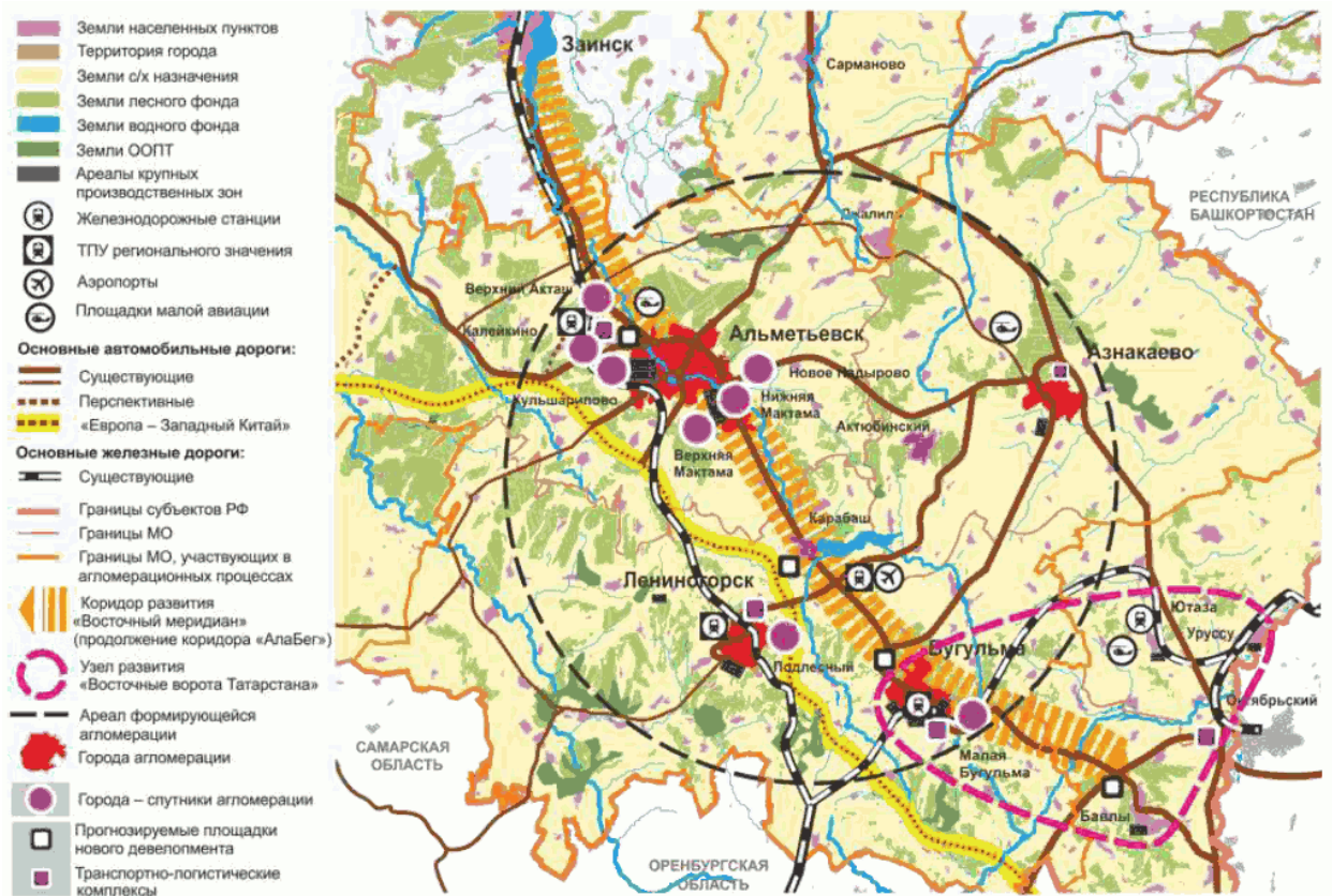
"Рис. 3.19. Пространственное развитие Альметьевской агломерации"

Планируемые к разработке и реализации программы: