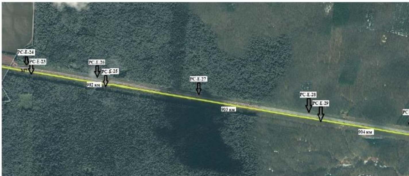
Вид рекламной конструкции: двухсторонний еврощит 3 x 6 метра. Площадь информационных полей: 18 м 2 с каждой стороны. Масштаб карты 1:10 000