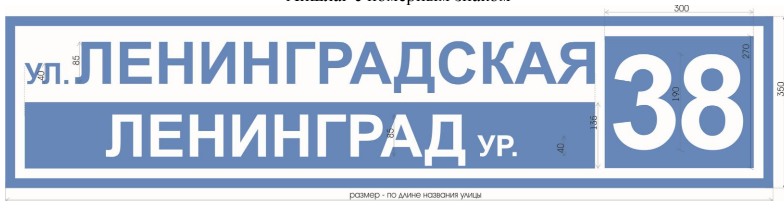
Аншлаг с номерным знаком

Приложение № 1 к Положению, регламентирующему оформление и установку указателей с наименованием улиц и номерами домов в муниципальном образовании «Мукмин-Каратайское сельское поселение» Лениногорского муниципального района Республики Татарстан