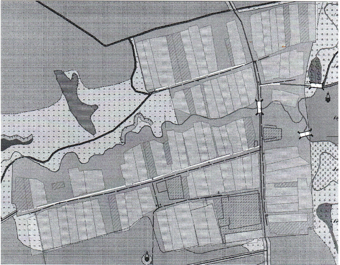
Схема системы водоснабжения н.п. Нижний Шандер Нижнешандерского сельского поселения Мамадышского муниципального района РТ