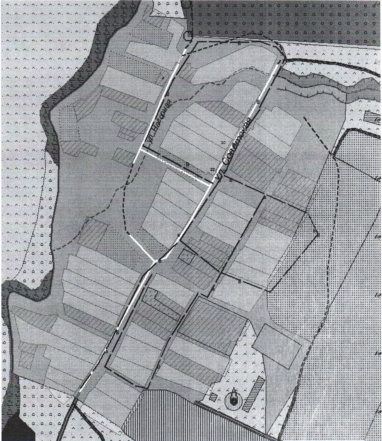
Схема системы водоснабжения н.п. Уткино Нижнешандерского сельского поселения Мамадышского муниципального района РТ