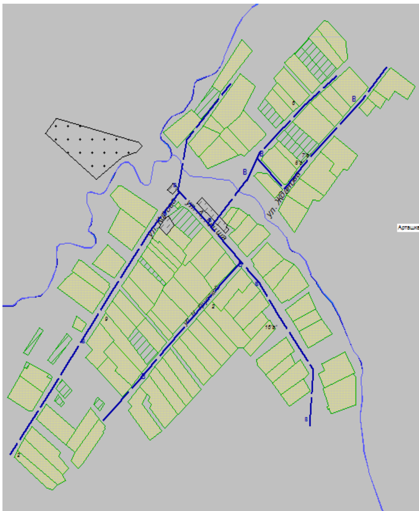
Схема водоснабжения н.п. Арташ Среднекирминского сельского поселения Мамадышского муниципального района РТ