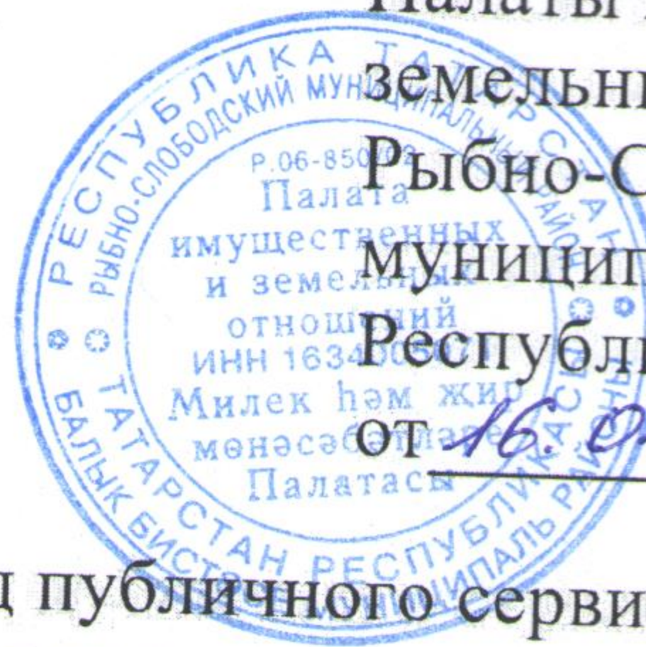
Схема расположения границ публичного сервитута в целях прохода или проезда через земельные участки по объекту: «Реконструкция моста через реку Ошняк на км 17+475 автомобильной дороги «Казань – Оренбург» - Рыбная Слобода в Рыбно-Слободском муниципальном районе Республики Татарстан»