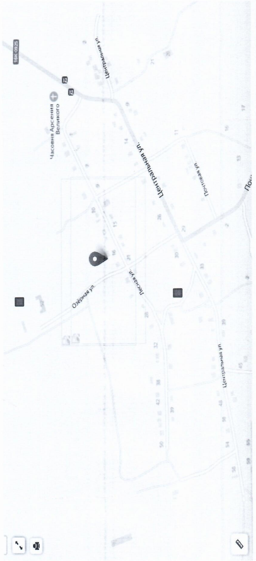
Схема мест размещения контейнерных площадок для сбора твердых коммунальных отходов с. Молькеево