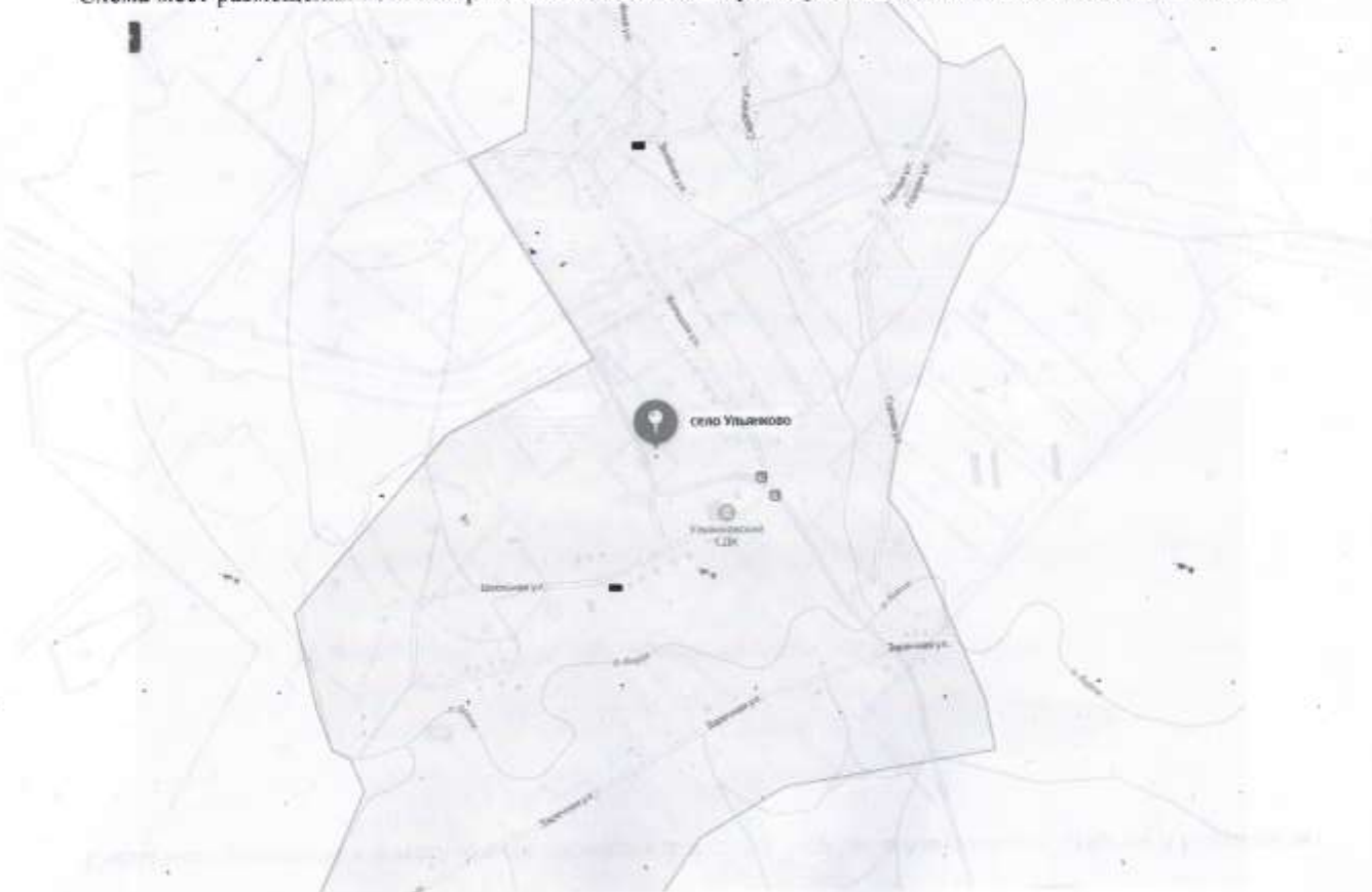
Схема мест размещения контейнерных площадок для сбора твердых коммунальных отходов с. Ульянково

Приложение №2 к постановлению Исполнительного комитета Ульянковского сельского поселения Кайбицкого муниципального района от 20.10.2023г. №60