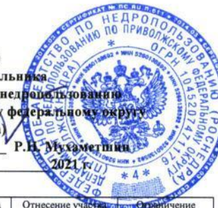
Дополнение № 1 к Перечню участков недр местного значения по Республике Татарстан