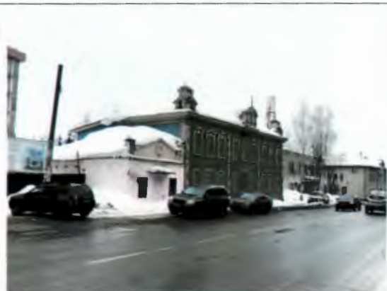
Общий вид здания с ул. Гладилова

Разрешается ремонт, реконструкция здания с сохранением внешнего облика, габаритов и высотных отметок дома; ремонт, замена оконных и дверных заполнений с сохранением исторического рисунка и материала; использование исторических материалов при отделке и восстановлении здания (тесовая обшивка, резной декор, дерево)