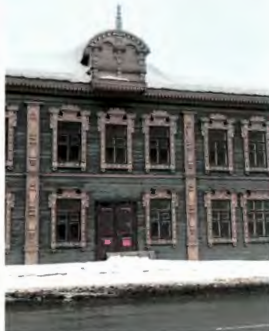
Центральная часть главного фасада