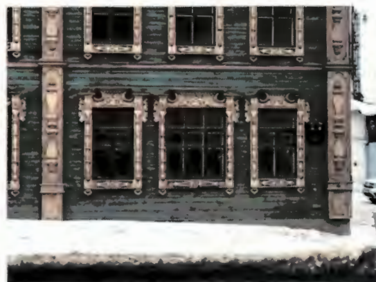
Оконные проемы 1 этажа