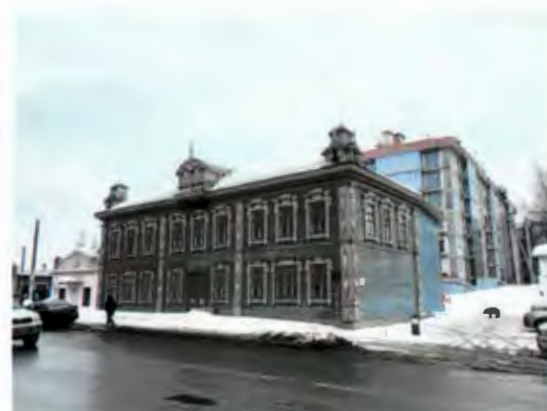
Общий вид здания с ул. Гладилова