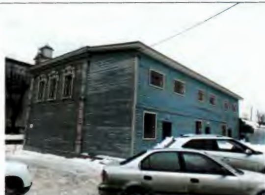
Общий вид со стороны двора