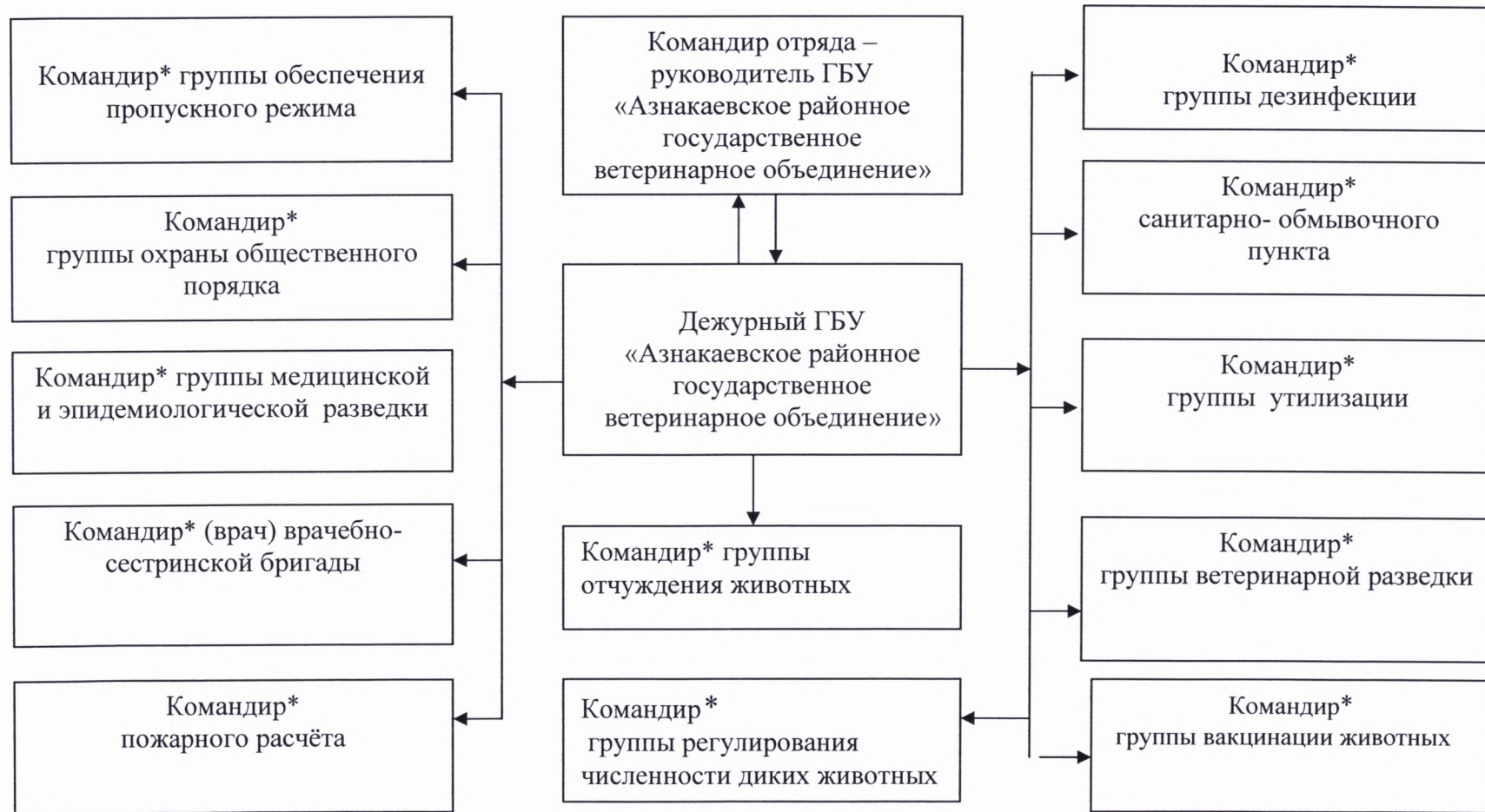
Схема оповещения командиров групп сводного мобильного противозoonотического отряда постоянной готовности Азнакаевского муниципального района в рабочее и нерабочее время

Примечание * - командиры подразделений оповещают личный состав по своей схеме оповещения