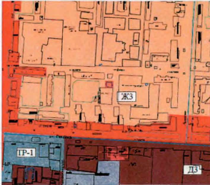
Выкопировка из правил землепользования и застройки

Генеральный план города Альметьевска Альметьевского муниципального района РТ, утвержденный Решением Альметьевского городского Совета Республики Татарстан от 31.05.2017 года №80 Правила землепользования и застройки, утвержденные Решением Совета Альметьевского муниципального района Республики Татарстан от 25.12.2009 года №366.