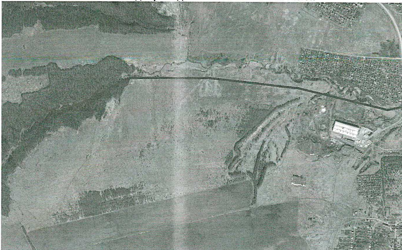
Схема водопроводных сетей с. Нижний Услон