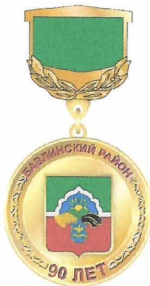
Рисунок юбилейной медали «Бавлинский район - 90 лет»

Медаль при помощи ушка и кольца соединяется с пятиугольной колодкой, покрытой эмалью зеленого цвета. Размер колодки – 21x18мм.