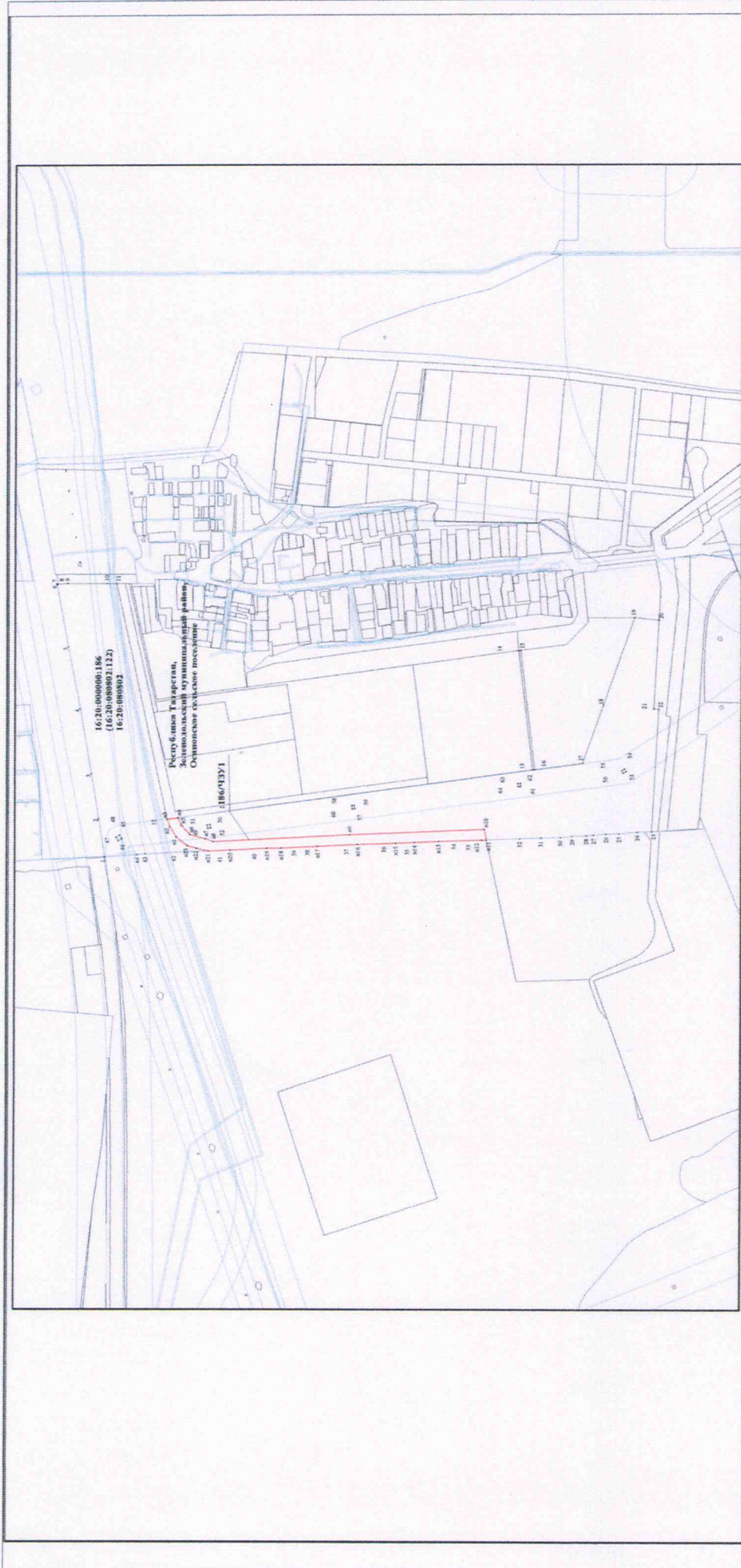
Масштаб 1:10 000, система координат: МСК-16