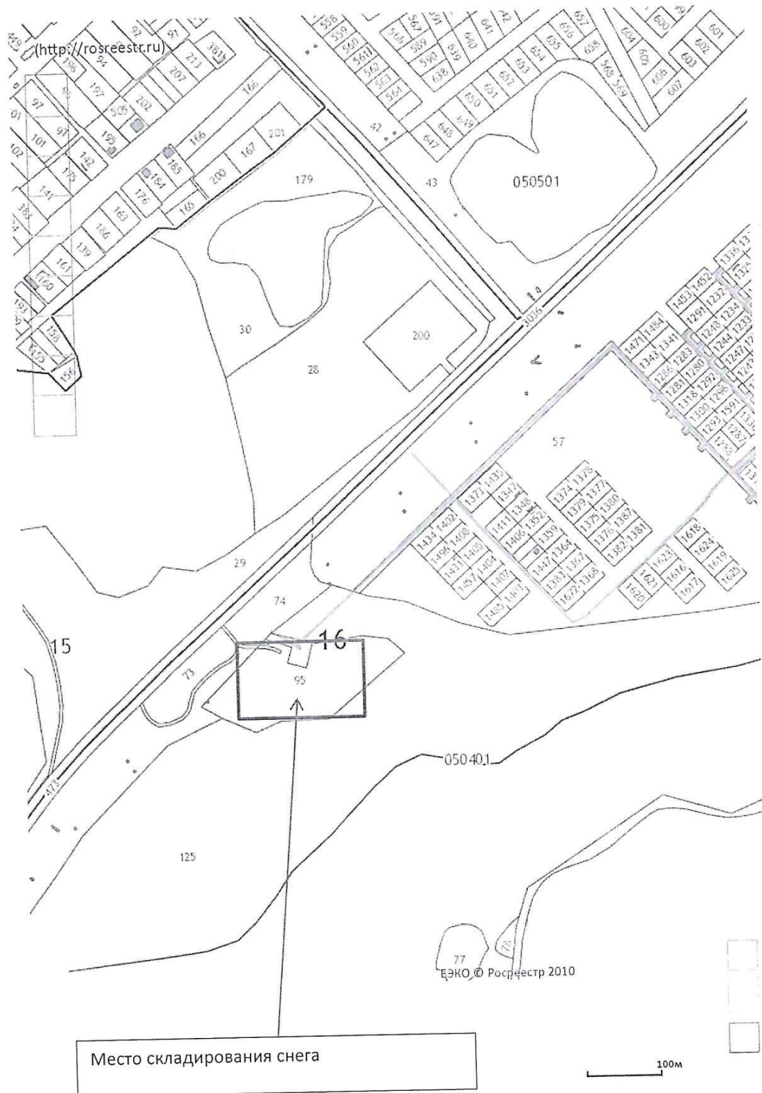
Схема расположения земельного участка для размещения площадки складирования снега