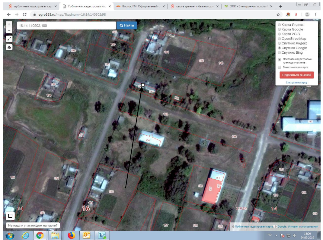
Место (площадка) накопления ТКО

2 С. Старые Тинчали, ул. Г. Гали, кадастровый номер квартала 16:14:210201: 092