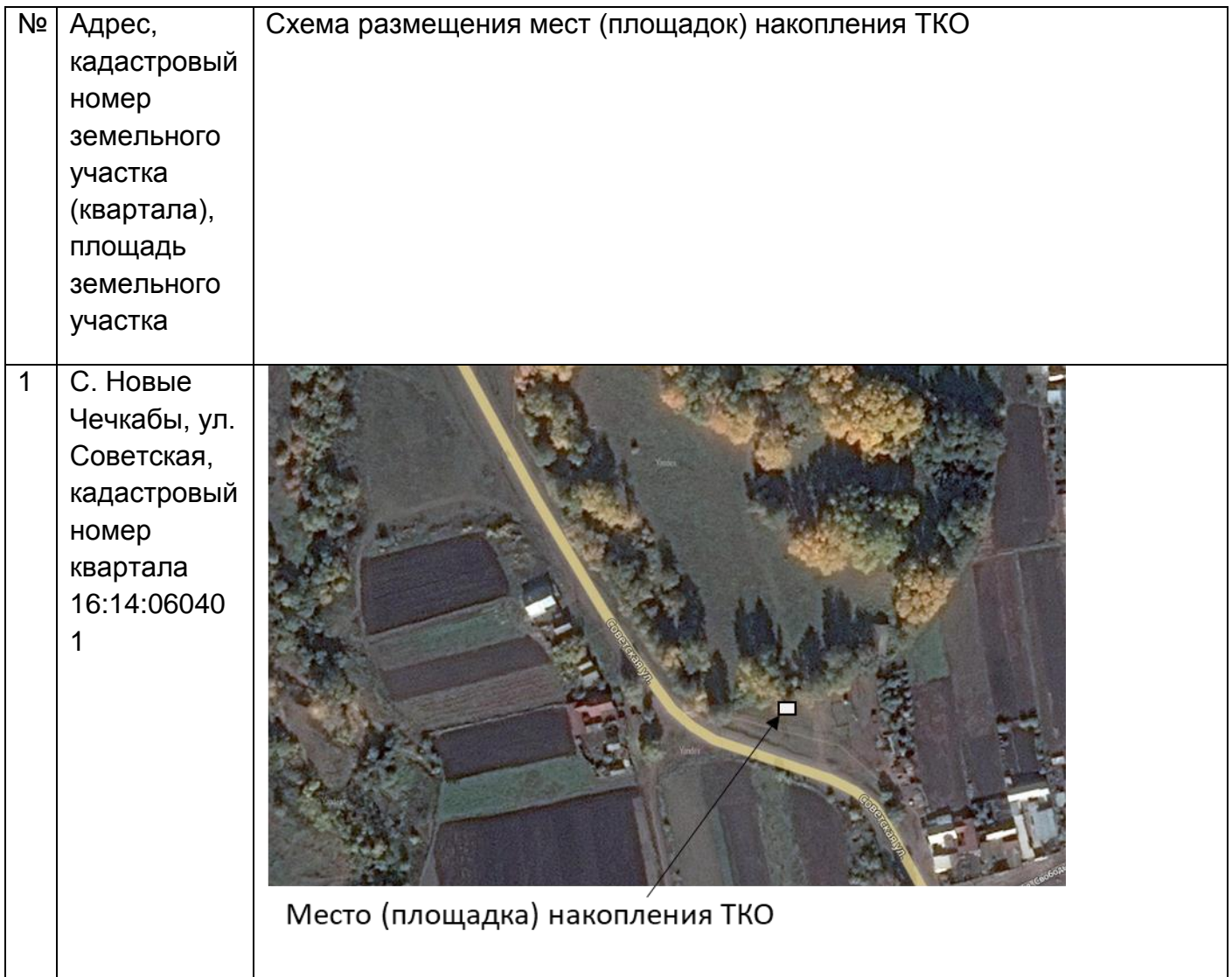
Схема размещения мест (площадок) накопления твердых коммунальных отходов на территории Новочечкабского сельского поселения Буинского муниципального района Республики Татарстан.