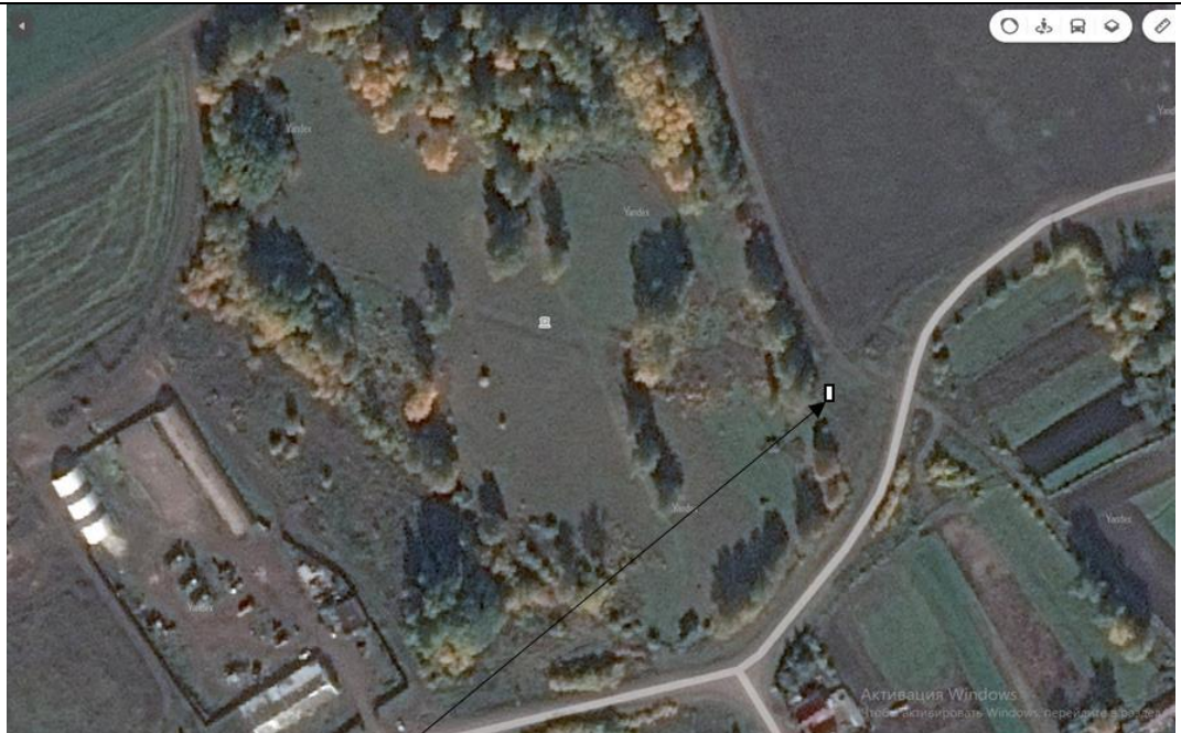
Место (площадка) накопления ТКО

5 Д. Ахмаметьев о, ул. Луговая, кадастровый номер квартала 16:14:06030 1