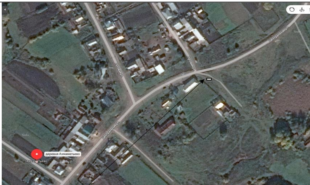
Место (площадка) накопления ТКО

6 Д. Ахмамetyев о, ул. Центральна я, д.16а, кадастровый номер квартала 16:14:06030 1