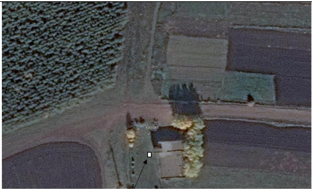
Место (площадка) накопления ТКО

4 С. Новые Чечкабы, ул. Дружба, д.27, кадастровый номер квартала 16:14:06040 1