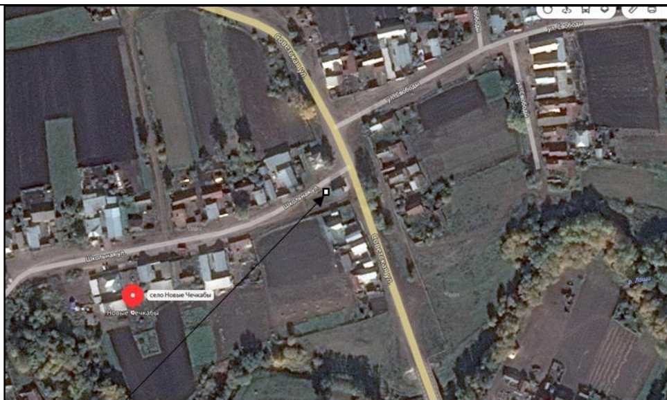
Место (площадка) накопления ТКО

2 С. Новые Чечкабы, ул. Советская, кадастровый номер квартала 16:14:06040 1