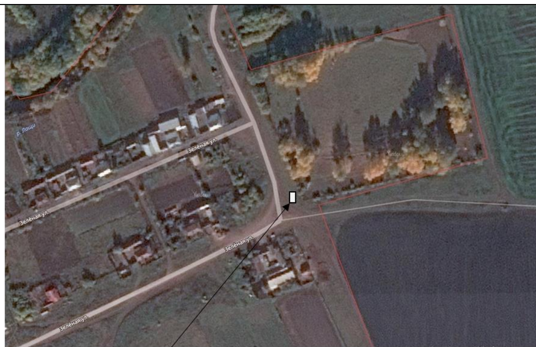
Место (площадка) накопления ТКО

9 д. Мамоткозино, ул. Зеленая, кадастровый номер квартала 16:14:06020 1