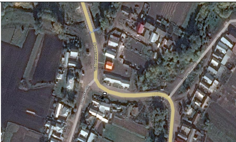
Место (площадка) накопления ТКО

3 С. Новые Чечкабы, ул. Советская, кадастровый номер квартала 16:14:06040 1