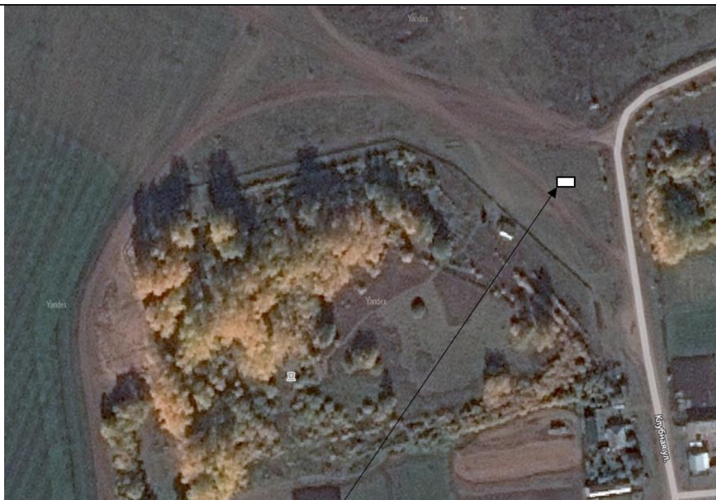
Место (площадка) накопления ТКО

8 д. Кыр-Тавгильдино, ул. Клубная, кадастровый номер квартала 16:14:06020 1