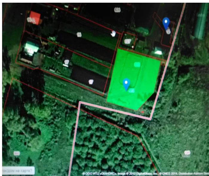
Место (площадка)накопления ТКО

РТ, Буинский район, д. Мещеряково, ул. Мусы Джалиля , д. 107, спортплощадка школы, кадастровый номер 16:14:140201:872 ориентировочная площадь 4 кв.м