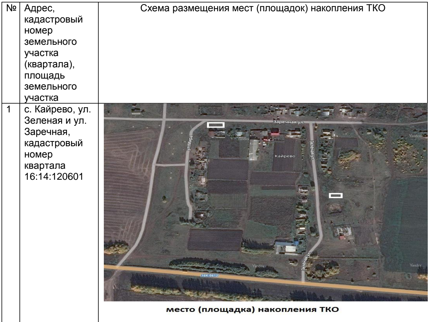
Схема размещения мест (площадок) накопления твердых коммунальных отходов на территории Альшиховского сельского поселения Буинского муниципального района Республики Татарстан.