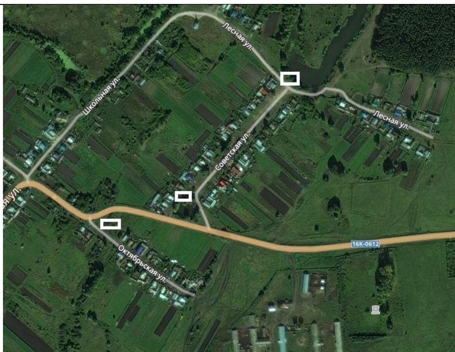
место (площадка) для размещения

6 д. Тингаш, ул. Лесная, ул. Советская, ул. Октябрьская, кадастровый номер квартала 16:14: 120501