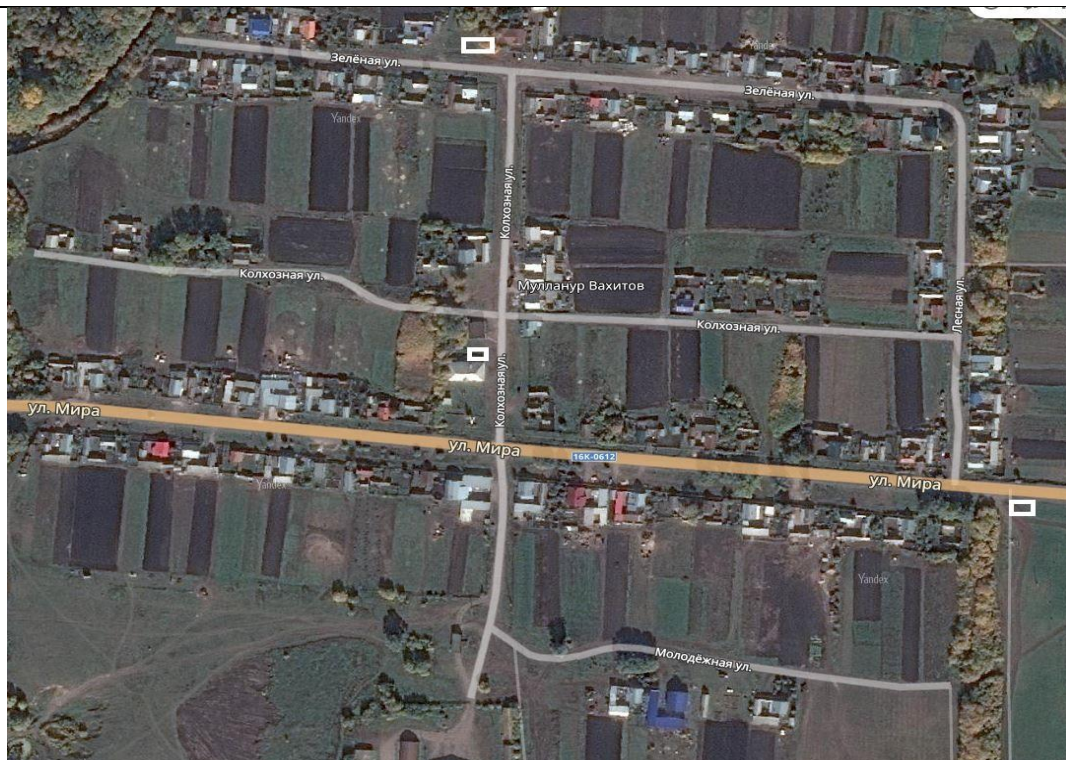
место (площадка) накопления ТКО

2 д. Мулланур Вахитово, ул. Зеленая, ул. Колхозная, ул. Мира, кадастровый номер квартала 16:14:120901