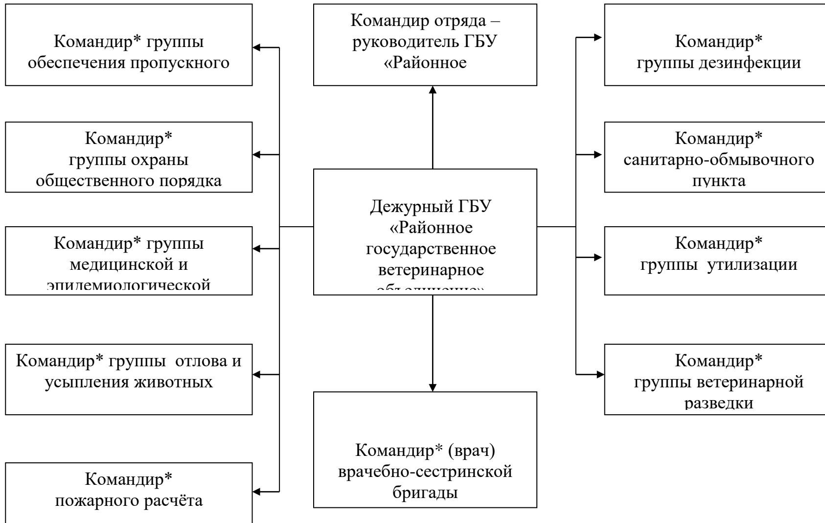
Схема оповещения командиров групп Отряда в рабочее и нерабочее время

Примечание * - командиры подразделений оповещают личный состав по своей схеме оповещения.