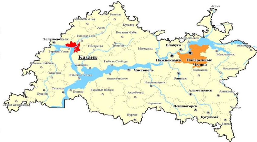
Рис. 1. Тукаевский район на карте Республики Татарстан

В 2012 году Камский инновационный территориально-производственный кластер Республики Татарстан вошел в Перечень инновационных территориальных кластеров, утвержденный Председателем Правительства Российской Федерации Д.А.Медведевым (поручение от 28.08.2012 № ДМ-П8-5060).