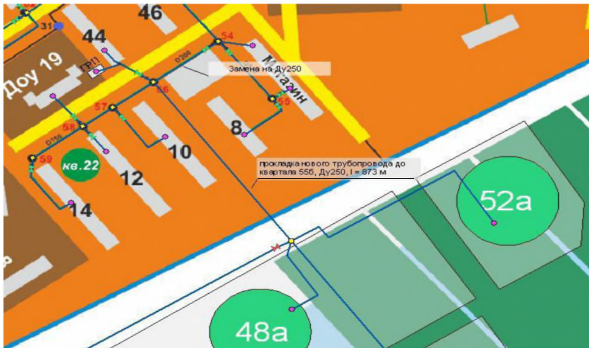
Рисунок 4. Замена существующего участка тр-да и прокладка нового тр-да в направлении квартала 55б

Для обеспечения возможности подключения потребителей тепловой энергии кварталов №48а, 52, 52а, 53а, 55б необходимо осуществить перекладку участка тепловой сети от тепловой камеры №56 до тепловой камеры №58 (на рисунке 4) с Ду200 мм на Ду250 мм протяженностью 67 м. От камеры №58 в направлении квартала 55б осуществить прокладку магистральной тепловой сети диаметром Ду250 мм и протяженностью l = 873 м.