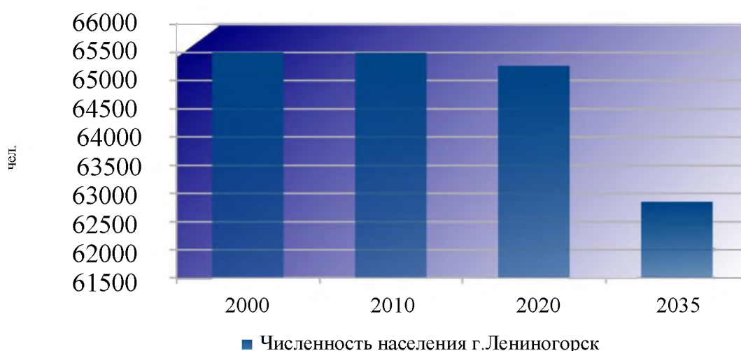
Динамика численности населения г. Лениногорск

На рис.2 приведена динамика численности населения г. Лениногорск.