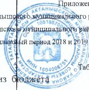
Таблица 1 Межбюджетные трансферты, получаемые из бюджета Республики Татарстан в денежном выражении на 2017 год (тыс.руб.)