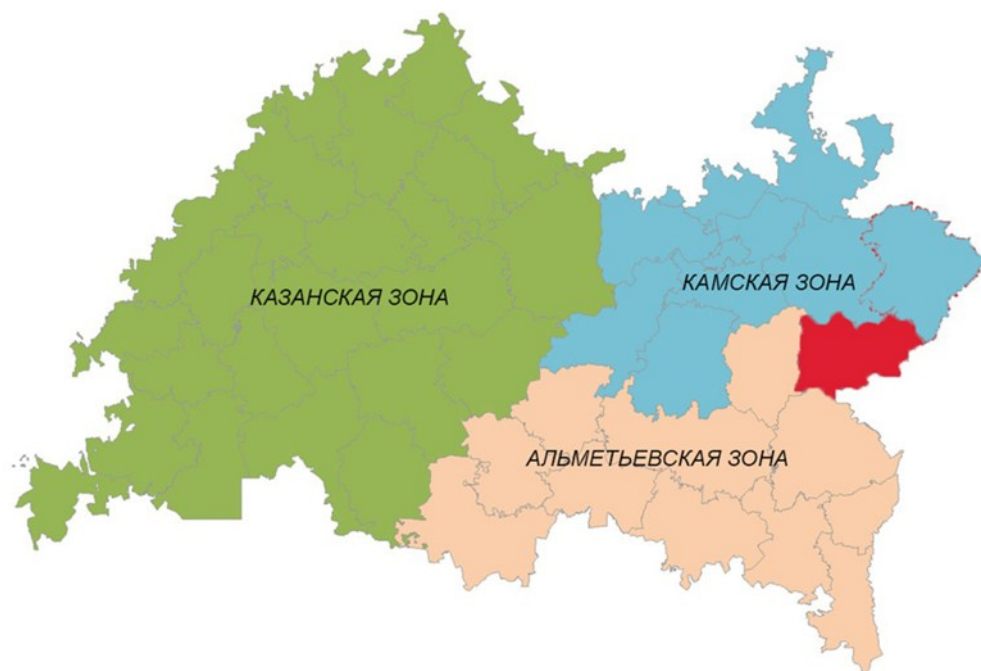
Рисунок 1. Карта Республики Татарстан в разрезе экономических зон

Муслимово, село в Республике Татарстан, центр Муслимовского района. Муслимовский район образован в 1930 году, расположен в восточной части