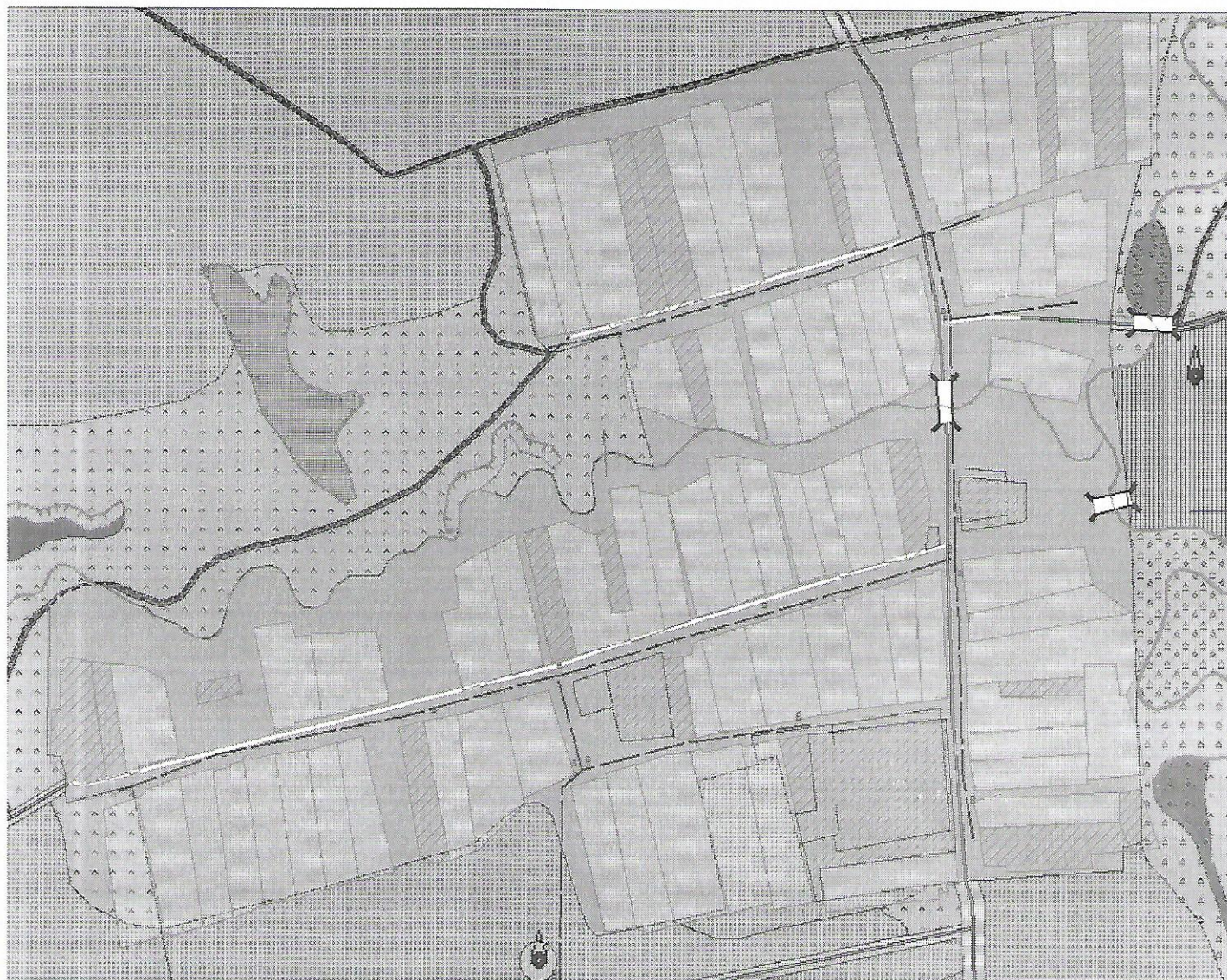
Схема системы водоснабжения н.п. Нижний Шандер Нижнешандерского сельского поселения Мамадышского муниципального района РТ