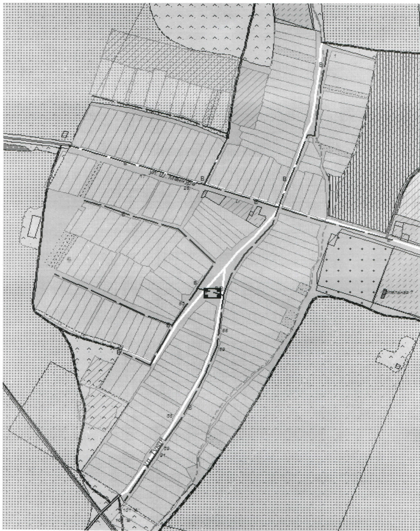
Схема системы водоснабжения н.п. Олуяз Олуязского сельского поселения Мамадышского муниципального района РТ