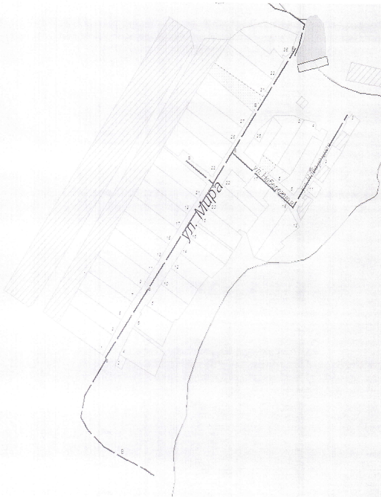
Схема системы водоснабжения п.п. Крященный Пакшин Красногорского сельского поселения Мамадышского муниципального района РТ