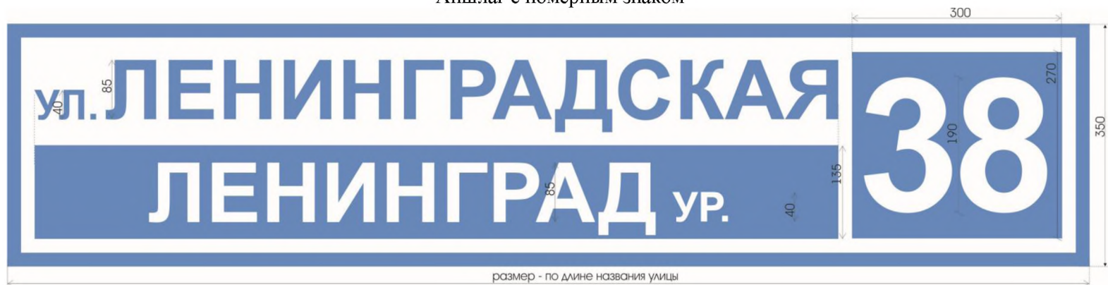
Аншлаг с номерным знаком

Приложение № 1 к Положению, регламентирующему оформление и установку указателей с наименованием улиц и номерами домов в муниципальном образовании «Письмянское сельское поселение» Лениногорского муниципального района Республики Татарстан