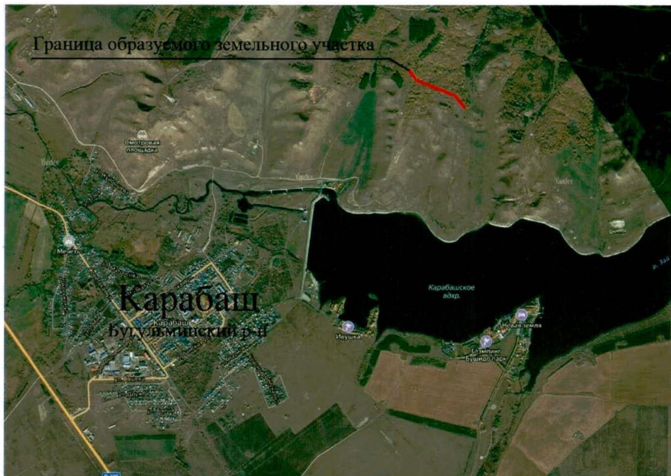
Схема расположения объекта