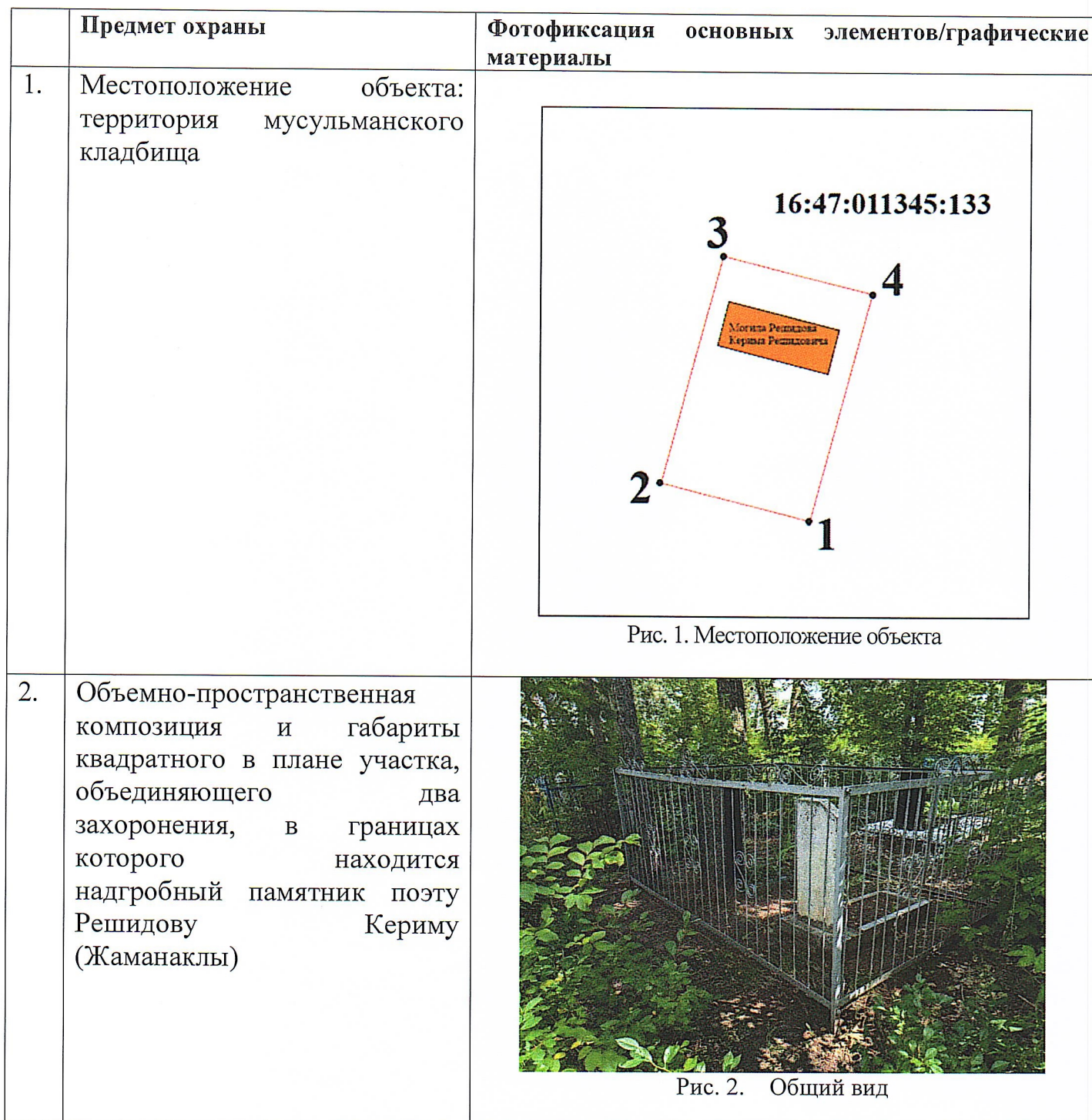
Таблица предмета охраны объекта культурного наследия регионального значения «Могила поэта Решидова Керима (Жаманаклы)», 1965 г., расположенного по адресу: Республика Татарстан, Елабужский муниципальный район, г. Елабуга, мусульманское кладбище