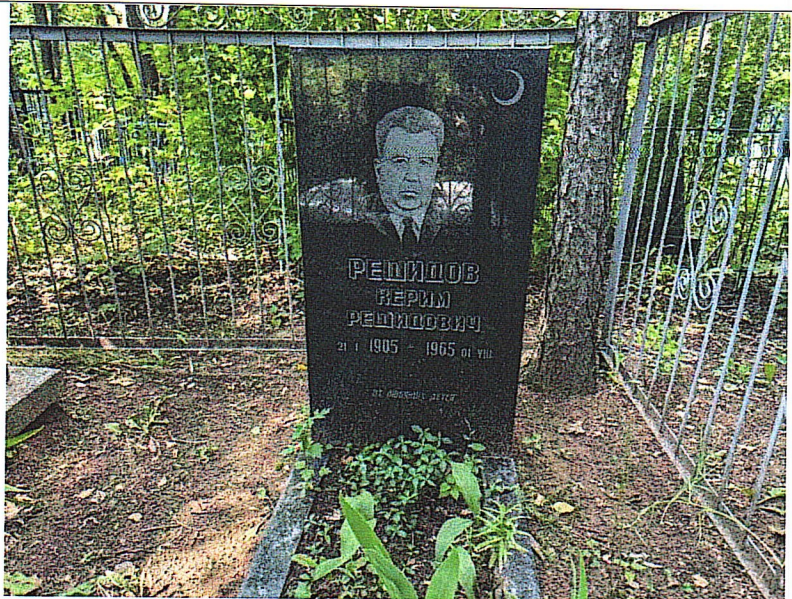
Рис. 3. Надгробный памятник