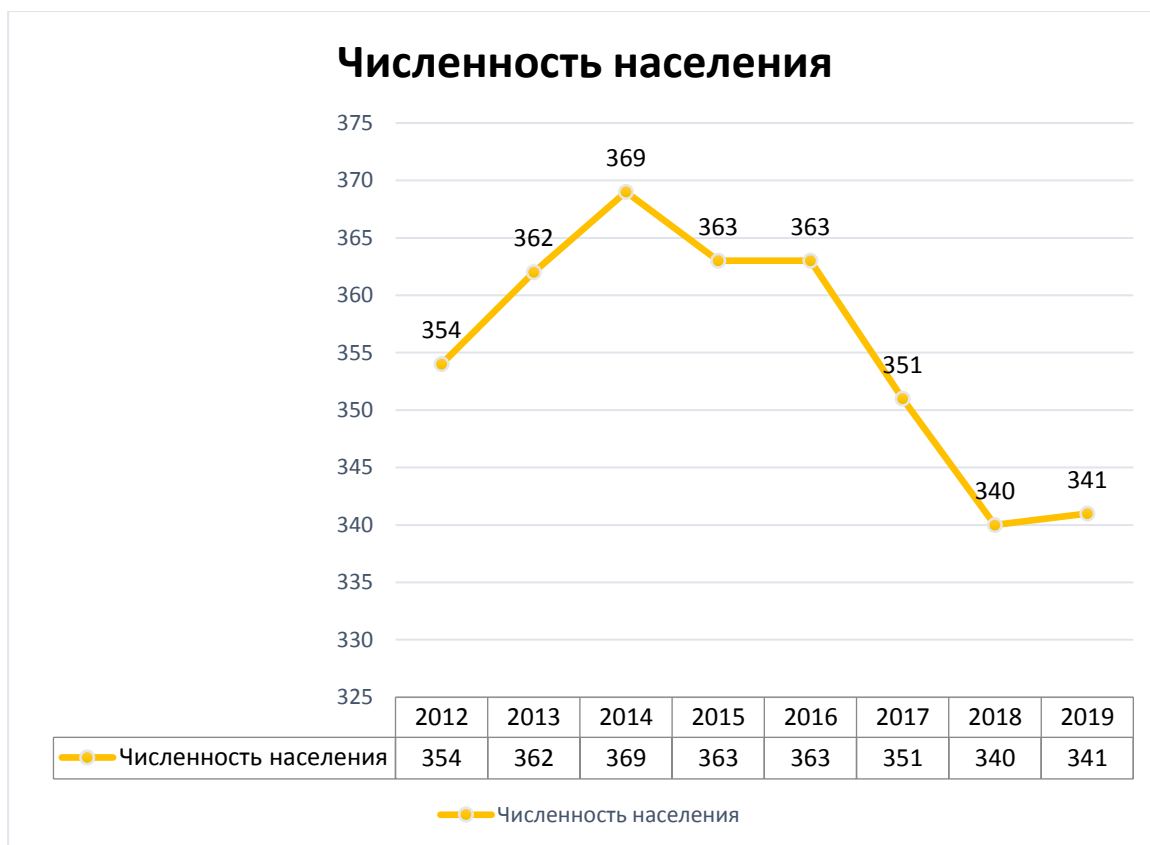
Рисунок 1– Динамика численности населения Альметьевского сельского поселения

Для наиболее полной оценки демографической ситуации важно оценить возрастную структуру численности населения. В таблице 1 показаны данные по возрастной структуре населения Альметьевского сельского поселения за 2011 год.