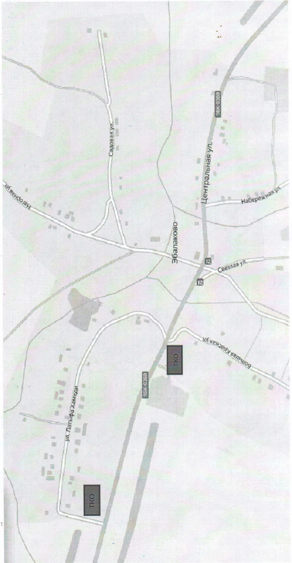
Схема мест размещения контейнерных площадок для сбора твердых коммунальных отходов с. Эбалаково