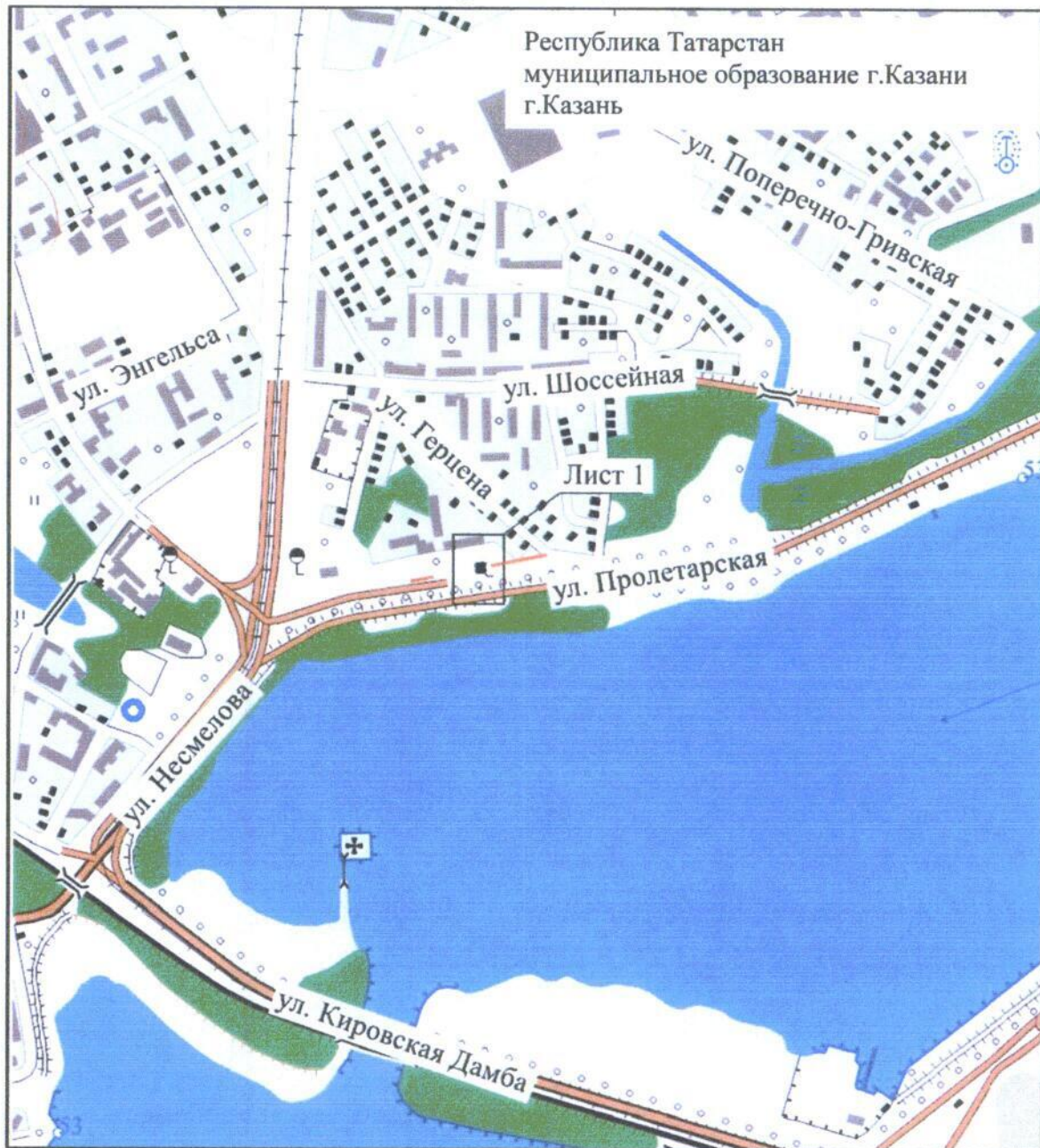
Обзорная схема границ объекта

Используемые условные знаки и обозначения: